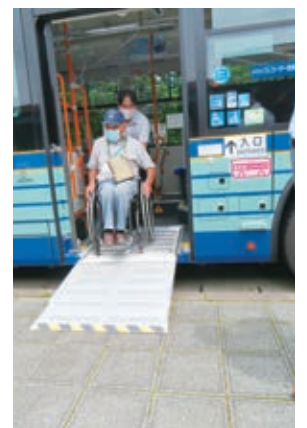
市営バスから降りる様子