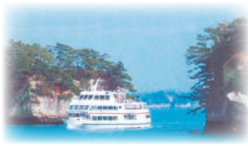
マリンゲート塩釜発着 貸し切りの船での塩釜湾内クルージング