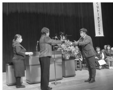
心の輪を広げる体験作文の表彰

令和7年度身体障害者レクリエーション教室「天平ろまん館で砂金取り体験をしよう」を実施しました