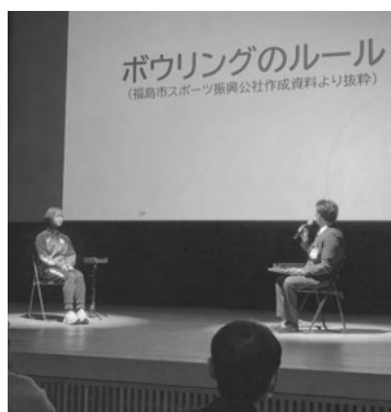
スポーツまちづくりトーク