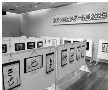
ウエルフェアアート展

◆ ウエルフェアアート展2025 同会場地下1階展示ホールでは、障害者週間のポスターや仙台市障害者による書道・写真・絵画コンテストの作品を展示しました。来場者の多くが熱心に鑑賞され、作品それぞれの豊かな感性と表現力に触れることができました。 本式典・展示には多数の方々にご来場いただき、盛況のうちに終了いたしました。来年も皆さまのご来場を心よりお待ちしております。