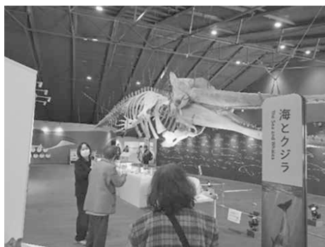
おしかホエールランド

『ホエールタウンおしか』内にある『おしかホエールランド』では、クジラの生態や特徴、牡鹿半島におけるクジラ文化を学びました。クジラの歯やひげを直接手で触れることができ、視覚障害の方にも好評でした。昼食にはクジラのお刺身、クジラのユッケ丼、クジラの味噌焼きとクジラ料理を堪能しました。その後『いしのまき元気いちば』へ移動し、物産品や海産物を買求めました。