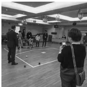
ポッチャ体験の様子

これからも会員や障害当事者の方がたと子どもたちがふれあいを深める場を設けていきたいと思えます。参加いただいた皆様ありがとうございました。