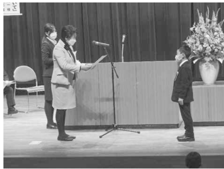
郡市長からの表彰

合純一氏、シドニーパラリンピック車いすバスケットボール男子日本代表キャプテン根木慎志氏、東京2020パラリンピックバドミントン女子日本代表銀メダリスト鈴木亜弥子氏、そして司会・コーディネーターとして元ミヤギテレビアナウンサー岩瀬裕子氏をお招きし、パネリストのこれまでの体験談や今後の取組などが紹介され、パラスポーツの魅力や素晴らしさ、市民とのかかわりについてデスカッションして頂きました。