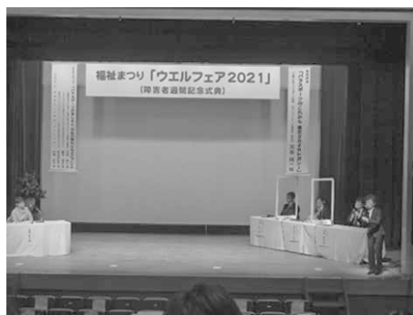
パネルディスカッションの風景

新型コロナウイルス感染症対策を考慮しての開催となりました。皆様のご協力のもと、滞りなく式典が開催できましたこと、心より感謝申し上げます。来年も皆様のご来場をお待ちしております。