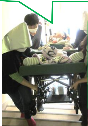
けが 怪我した時の たいおうれんしゅう 対応練習もばっちり！