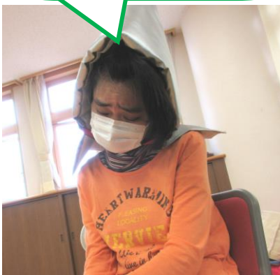
ぼうさいげきん ひなん 防災頭巾で避難だー！

しょくいんぜんいん 職員全員で訓練しています。 こんごう ひなんくんれん ようす 今号では、避難訓練の様子をご紹介します！