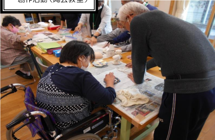
創作活動 (陶芸教室)