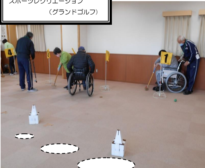
スポーツレクリエーション (グランドゴルフ)