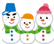
クリスマス工 こうさく 作