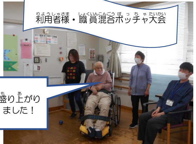
利用者様・職員混合ポッチャ大会